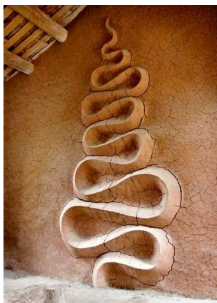
Le refuge d'art du Vieil Esclangon