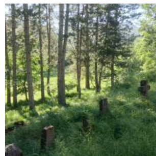
Le refuge d'art de La Forest et ses abords immédiats