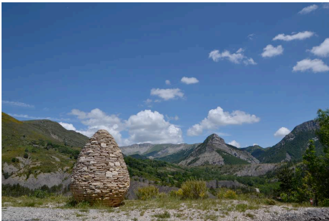
La sentinelle du Vanson